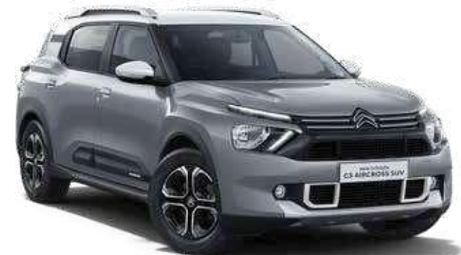
STEEL GREY BODY WITH POLAR WHITE ROOF