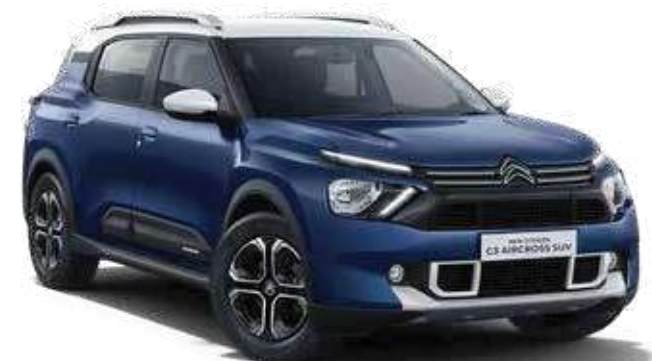
COSMO BLUE BODY WITH POLAR WHITE ROOF