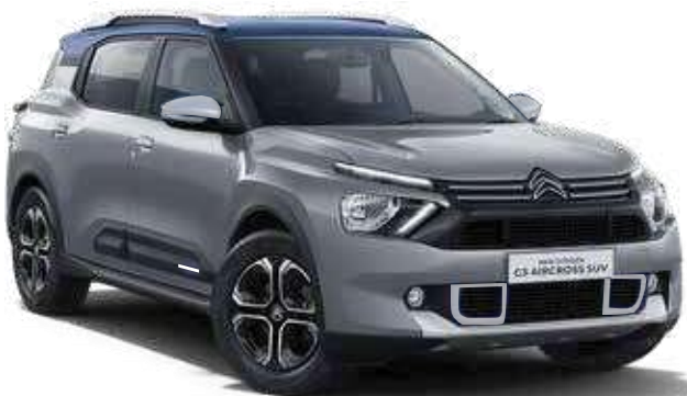
STEEL GREY BODY WITH COSMO BLUE ROOF