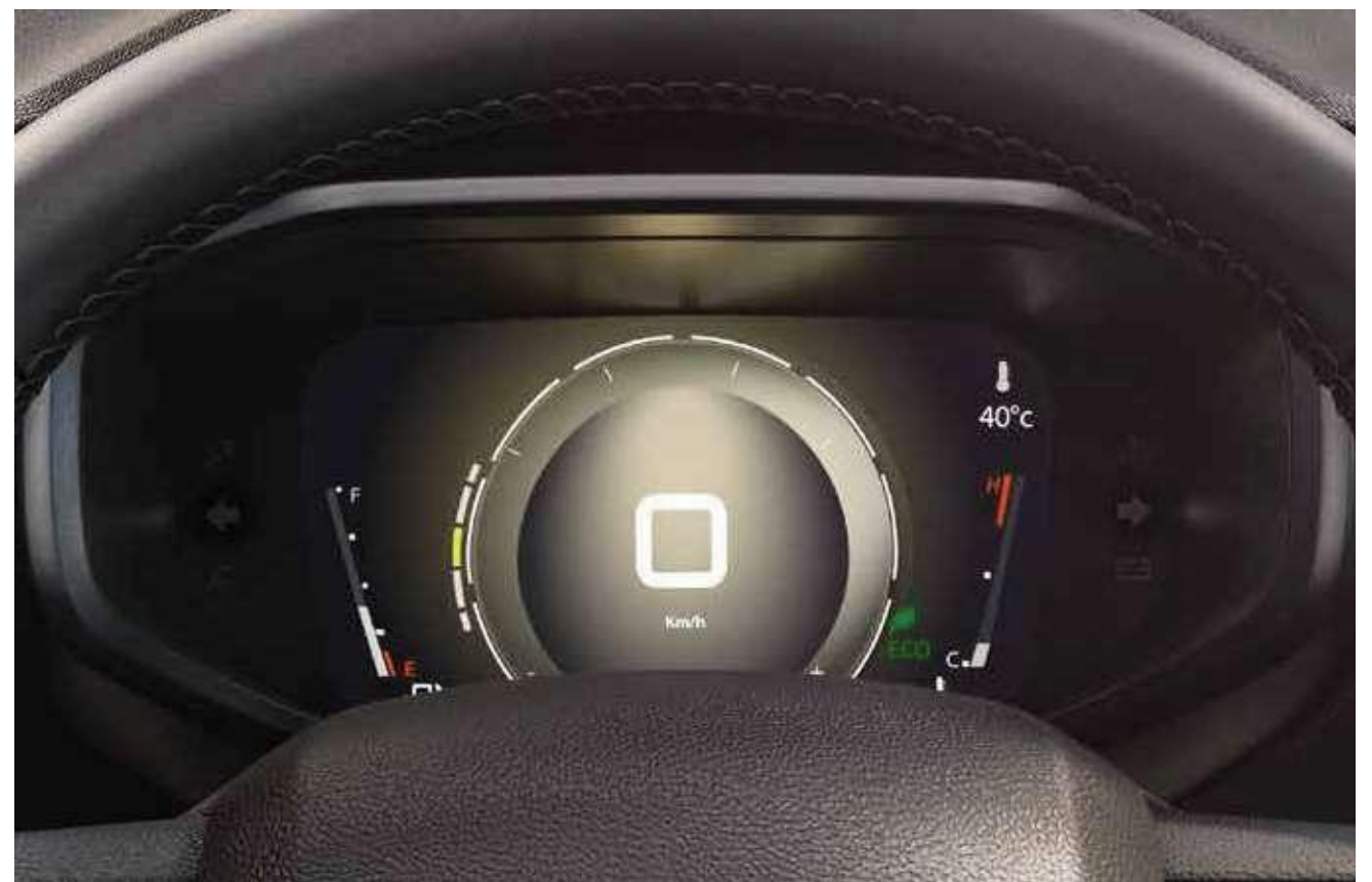
TAMPILAN DENGAN TEMA PERUNGGU