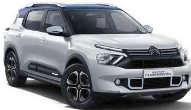
POLAR WHITE BODY WITH COSMO BLUE ROOF