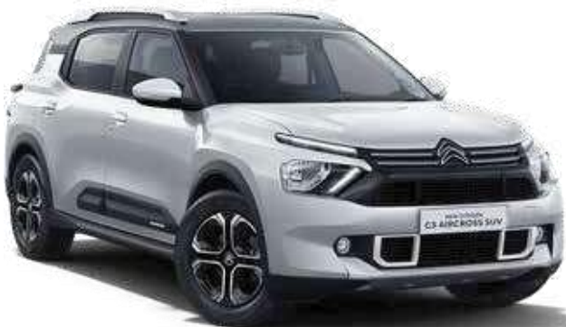
POLAR WHITE BODY WITH PLATINUM GREY ROOF