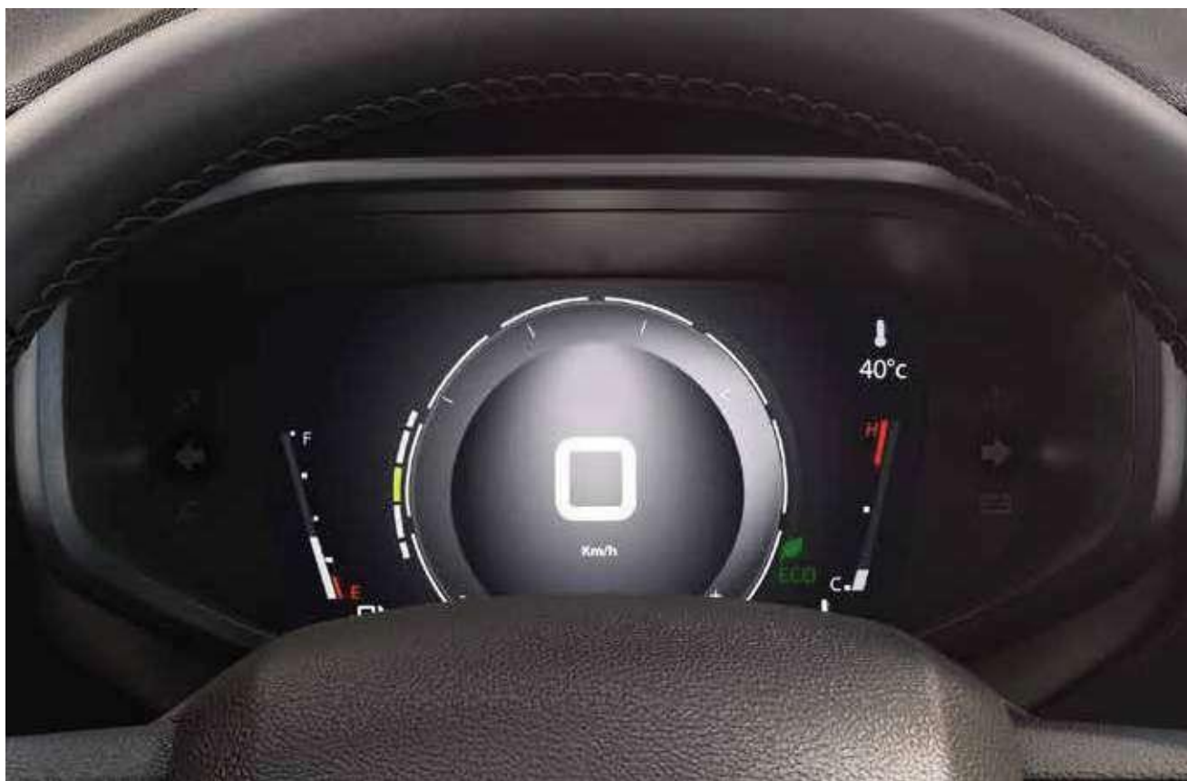
TAMPILAN DENGAN TEMA ABU-ABU