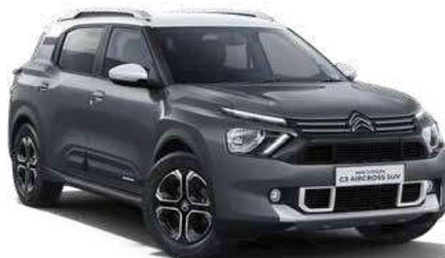
PLATINUM GREY BODY WITH POLAR WHITE ROOF